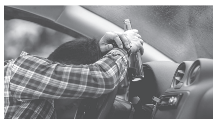
Езда в нетрезвом состоянии чревата серьезными последствиями

На заседании обсуждены возникающие вопросы правоприменения указанной меры социальной поддержки. Комиссией